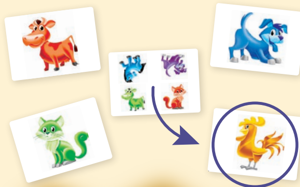
Figure out which animal and which color is missing and find it among the animal cards scattered about. Whoever finds the right animal first receives the herd card as a point. The player with the most cards at the end of the game is the winner!

On each of the herd cards, one of the five animals and one of the five colors is missing.