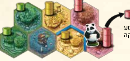
הוא אוכל מקטע במבוק מהחלקה בה עצר