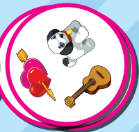
(ערימה של שחקן א')