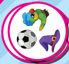
(ערימה של שחקן ב') שחקן ב')