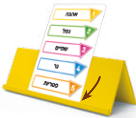
שפת הלוח מחזיקה את הקלף

השחקן המנחש לוקח את הקלף העליון מהערימה מבלי להסתכל בו ומניח אותו על גב המעמד שלו כך שכל השחקנים האחרים מלבדו יכולים לקרוא.